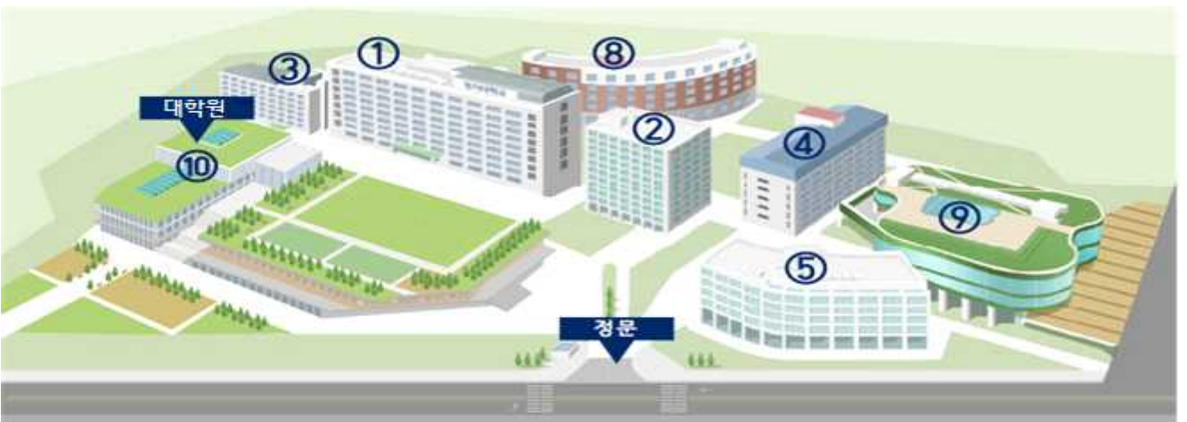
① 종합관 ② 학생회관 ③ 미래관 ④ 국제관 ⑤ 행정동 ⑧ 생활관 ⑨ 방목학술정보관 ⑩ MCC(3층 10350호 대학원)