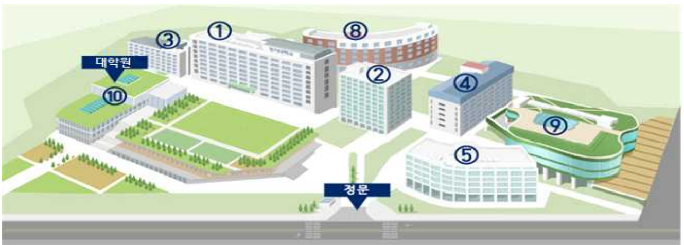
① 종합관 ② 학생회관 ③ 미래관 ④ 국제관 ⑤ 행정동 ⑧ 생활관 ⑨ 방목학술정보관 ⑩ MCC(3층 10350호 대학원)