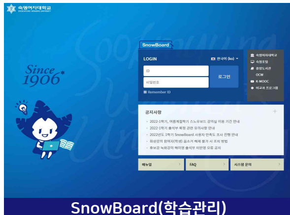
SnowBoard(학습관리) 금학기에 수강신청한 과목들의 온라인 강의실